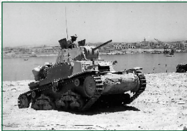
Carro medio M 13/40

Dal 1940 le unità carriste furono dotate inizialmente del nuovo carro medio M 13/40 e, successivamente, delle sue evoluzioni M 14/41 e M 14/42, con i quali, in condizioni di crescente disparità con i carri del nemico e dell'alleato, furono combattute epiche battaglie, di cui le più famose furono senz'altro quelle combattute a Bir el-Gobi, in Libia, ad Ain el-Gazala ed El-'Alamein, in Egitto, e a Kasserine, in Tunisia. Durante l'ultima