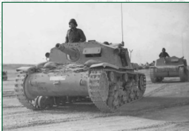
Semovente M 40 da 75/18

Dal 1940 le unità carriste furono dotate inizialmente del nuovo carro medio M 13/40 e, successivamente, delle sue evoluzioni M 14/41 e M 14/42, con i quali, in condizioni di crescente disparità con i carri del nemico e dell'alleato, furono combattute epiche battaglie, di cui le più famose furono senz'altro quelle combattute a Bir el-Gobi, in Libia, ad Ain el-Gazala ed El-'Alamein, in Egitto, e a Kasserine, in Tunisia. Durante l'ultima