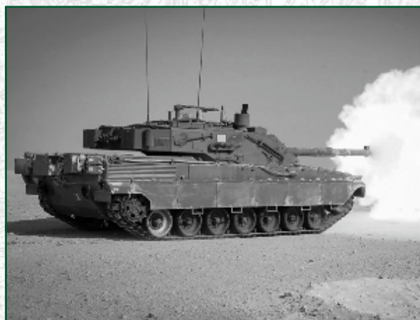
Carro Ariete C1

Nel 1998 iniziarono a essere distribuiti ai reparti i primi esemplari (dei 120 ordinati) del nuovo carro da battaglia C1 "Ariete" interamente progettato e costruito in Italia. Un plotone di carri Ariete fu impiegato operativamente in Iraq nell'ambito dell'Operazione Antica Babilonia. Se ne attende la sostituzione con la nuova versione "Ariete II".