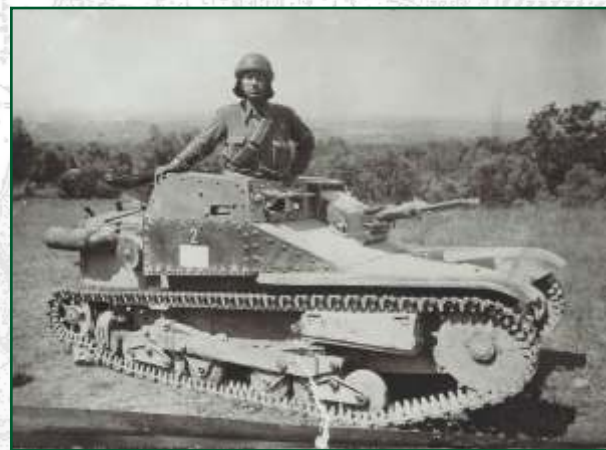
Carro Veloce CV 3/33

Nei due conflitti (guerra d'Etiopia e guerra di Spagna) che videro impegnate truppe italiane tra le due guerre mondiali, non essendo stati prodotti carri armati più moderni, meglio armati e protetti, la specialità carrista poté utilizzare soltanto mezzi leggeri, come i