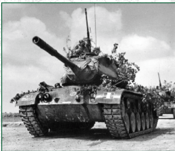
M 47 "Patton"

Alla fine della Seconda guerra mondiale in Italia non esistevano più unità carriste. Soltanto nell'immediato dopo guerra, in previsione dell'ingresso dell'Italia nella NATO (che avverrà il 4 maggio 1949), vennero ricostituite grandi unità a livello di reggimenti carri, che andarono a confluire nel 1948 nella Brigata Corazzata "Ariete" e nel 1951 nella Brigata Corazzata "Centauro" (entrambe poi divenute Divisioni dal 1952). I carri di cui furono dotati le unità carriste del neonato Esercito Italiano provennero dal surplus dell'U.S. Army, a partire dai carri leggeri M 3 "Stuart" e M 26 "Chaffee" e dai carri da battaglia M 4 "Sherman",