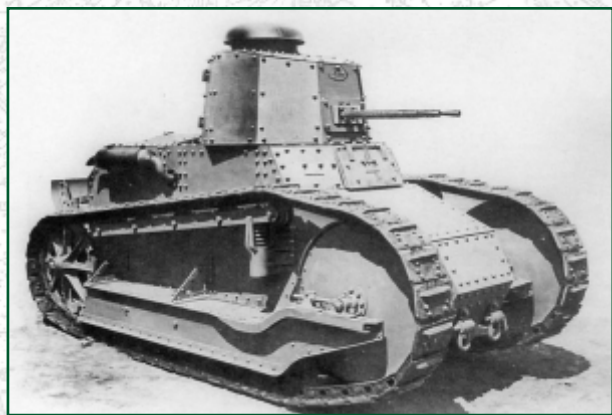
Carro d'assalto Fiat 3000 Mod. 21

La nascita ufficiale della specialità carrista viene fatta risalire al 1° ottobre 1927, con la costituzione (per trasformazione del preesistente Reparto Carri Armati costituitosi nel gennaio 1923 a Roma) del Reggimento Carri Armati, dotato del carro armato leggero Fiat 3000 mod. 21. Ma già nove anni prima, nel dicembre 1918, il Regio Esercito, creando la Batteria Autonoma Carri d'Assalto, aveva iniziato l'impiego dei primi carri,