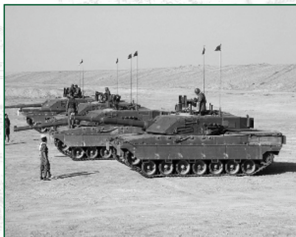
Plotone di C1 Ariete in Iraq

Attualmente i reggimenti carristi, con complessive nove compagnie carri, sono quattro: il 1° a Teulada, il 4° a Persano, il 32° a Tauriano e il 132° a Cordenons.