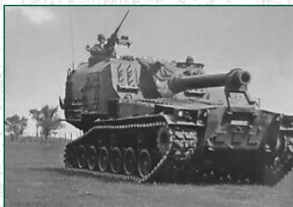
Semovente M55 con Obice da 203/25

Per aggiornare alcuni Leopard, in attesa dell'entrata in linea di un nuovo carro, furono acquistate 120 torrette della versione A5, installandole su altrettanti carri sottoposti a importanti lavori di manutenzione.