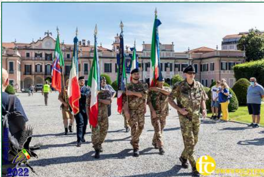
Nella foto è ripreso il gruppo Bandiere delle Sezioni Unuci che hanno partecipato alla manifestazione, visti prima della cerimonia di premiazione che si è svolta presso i Giardini Estensi a Varese.