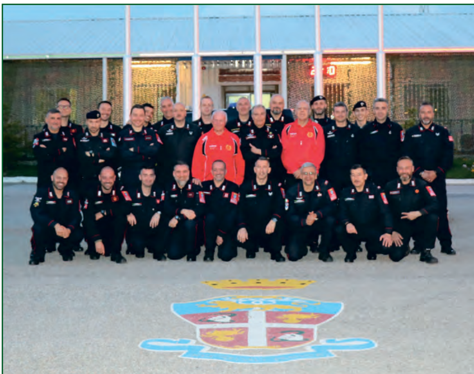
Reggimento Carabinieri MSU - KFOR - Kosovo.