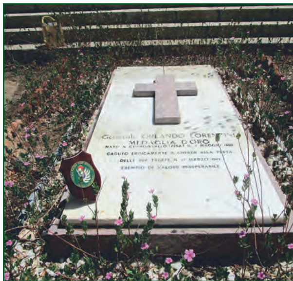
CHEREN Cimitero militare italo-eritreo (Cimitero degli Eroi). Sepoltura del Generale Orlando Lorenzini.