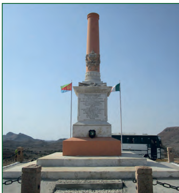
DOGALI Monumento in onore ai soldati italiani caduti nel 1887.