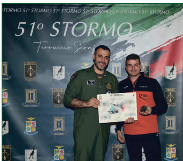
51° Stormo dell'Aeronautica Militare - Codroipo.

Nel 2018 a riconoscimento dell'attività e della serietà con cui viene condotta la stessa, il citato Ufficiale è stato nominato dal DOSB "Verbindungsoffizier zwischen DOSB (DSA)