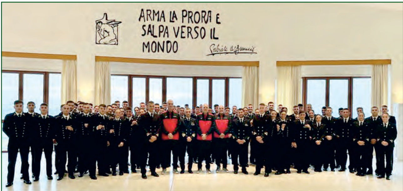
Accademia Navale - Livorno.

Nel frattempo la nostra struttura si è evoluta: dai primi anni, dove solo un nostro Ufficiale aveva l'onere e l'onore di effettuare le valutazioni (Prüfer), lo stesso ha fortemente voluto la nomina di altri valutatori/esaminatori, in rappresentanza di tutte le FFAA e della GdF. Oggi sono 10 i Prüfer, militari di ogni ordine e grado, in servizio ed in congedo ma tutti iscritti alla Sezione UNUCI di Gallarate, coordinati dal nostro Ufficiale, che si recano (sempre nel loro tempo libero e gratuitamente, vero esempio di volontariato) presso i Reparti ed Unità che ci chiedono di organizzare una sessione del DSA.