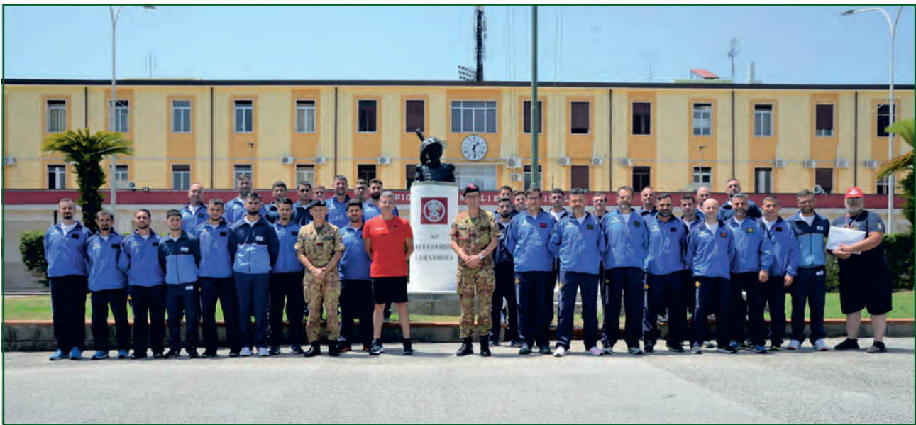
8° Reggimento Bersaglieri - Caserta.

un den italienischen Streitkräften und Staatspolizei ” cioè “Ufficiale di Collegamento tra il DOBS (DSA) e le FFAA/FFPP Italiane” .