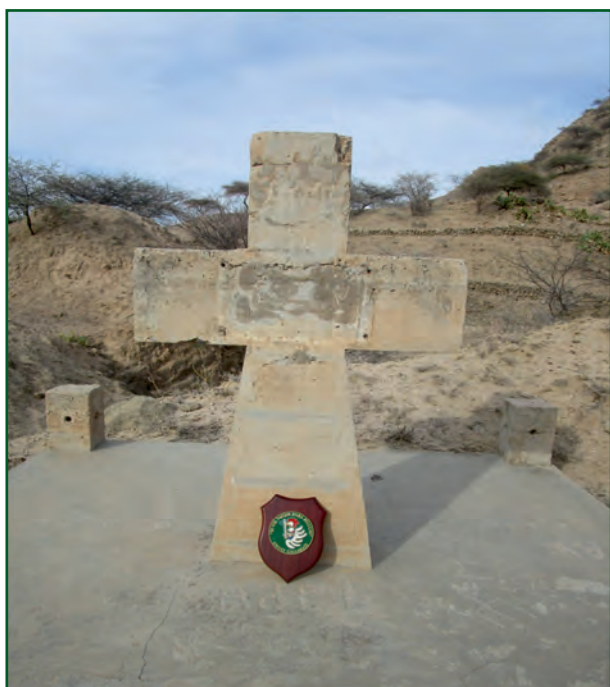
CHEREN Cimitero militare italo-eritreo degli Eroi.

L'ossario conserva i resti di 3.643 Caduti nella prima campagna d'Africa. L'obelisco di granito che sovrasta il monumento ai caduti, reca l'iscrizione "La Patria ai Caduti di Adua 1° Marzo 1896".