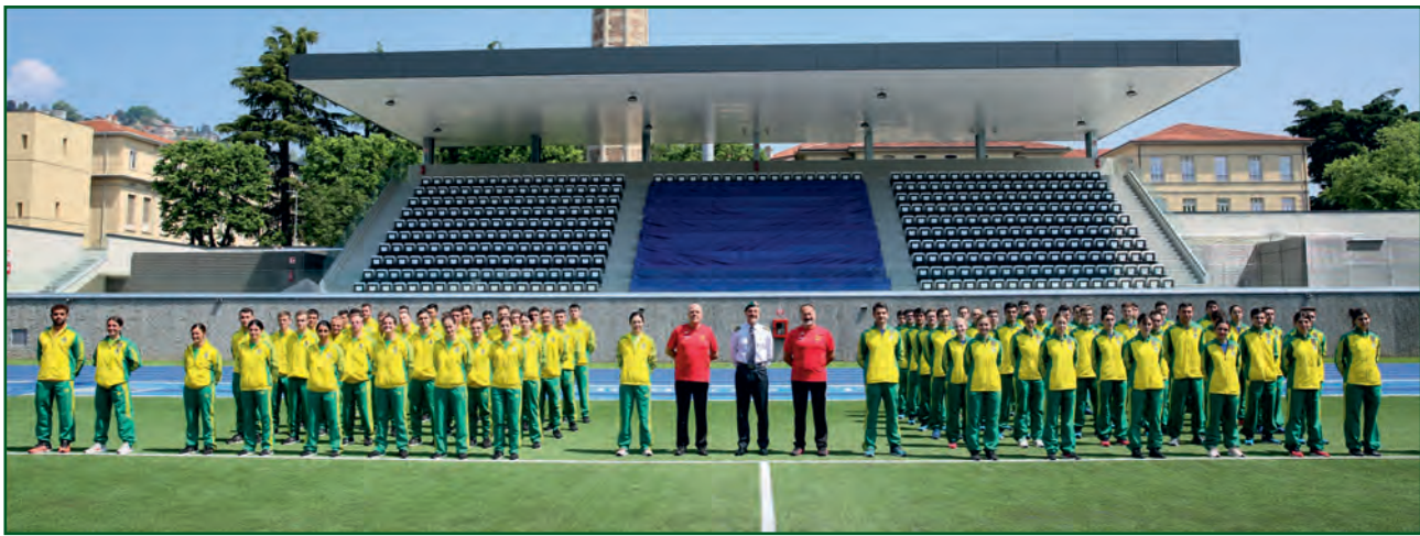
Accademia della Guardia di Finanza - Bergamo.